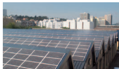
Saint Etienne HEF

L'installation de 359 kW a été construite sur une halle de production du Groupe HEF, à la Cité du Design de Saint-Etienne, à 60 km de Lyon. L'entreprise est spécialisée dans les traitements et revêtements de surfaces. //