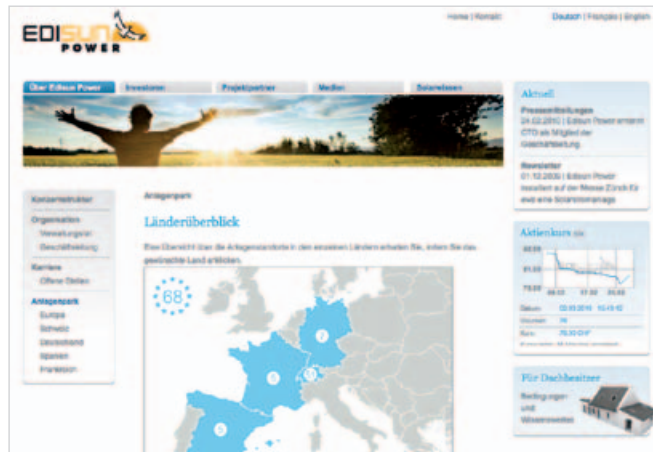
Parc d'installations : afficher par pays, par année de construction, etc.