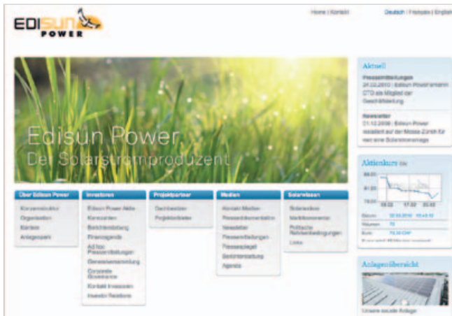
Accueil: clairement structuré