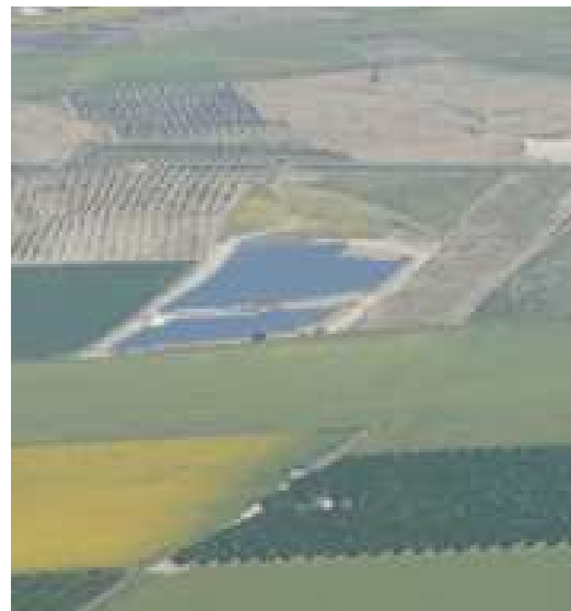
... mal von fern