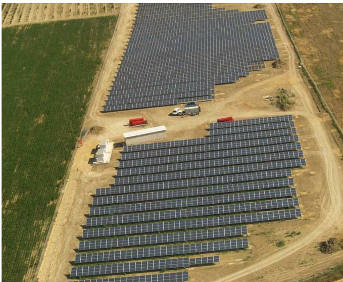
Mal von nah: El Trujillo....

Wir freuen uns darauf, die Edisun Power Gruppe nun mit noch mehr Schwung erfolgreich weiter zu entwickeln, und zählen auf Ihre Unterstützung.