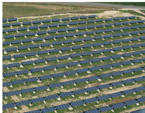
... mal von nah: El Tesoro