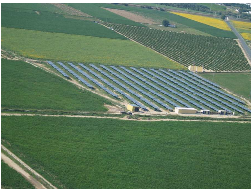
Mal von fern....

Nach einer längeren Phase der administrativen Bearbeitung ist in Spanien der Solarpark Edisun Power I „El Tesoro“ nun vollständig in Betrieb und erzeugt Solarstrom. Zudem steht unsere bisher grösste Anlage in der Endphase des Bewilligungsverfahrens: Der Solarpark Valle Hermoso soll eine Leistung von 2'300 kW bringen, wovon 200 kW gebäudeintegriert geplant sind. Energes, der Photovoltaikspezialist, der für Edisun Power Iberia bis jetzt sämtliche Anlagen gebaut hat, wird auf dem Gelände Valle Hermoso im Baurecht sein Betriebsgebäude errichten. Der Bau soll noch dieses Jahr beginnen, die Inbetriebsetzung ist für Mitte des nächsten Jahres geplant.