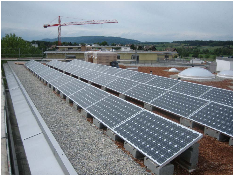
Installation "Wolfswinkel" sur des bâtiments Minergie de l'Allgemeine Baugenossenschaft Zürich ABZ

Les installations de l'Allgemeine Baugenossenschaft Zürich ABZ (Coopérative générale de construction) sont maintenant en construction et une première étape a déjà été mise en service. Conformément au programme de construction, cette installation sera raccordée au réseau en plusieurs temps.